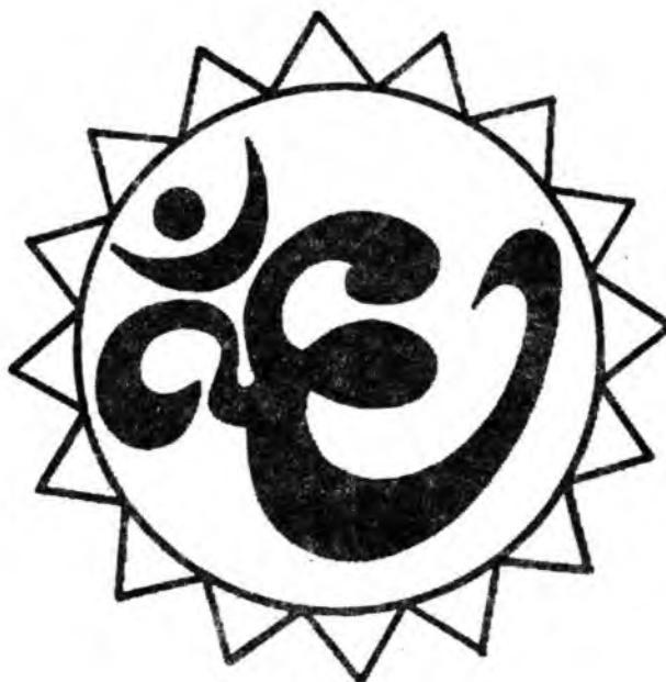
Рисунок для фиксации глаз

Вариант 3. Вокруг знака проведена окружность. Перемещайте свой взгляд по окружности, двигая одновременно глаза и голову. Делайте упражнение вначале с открытыми глазами, затем с закрытыми, представляя окружность.